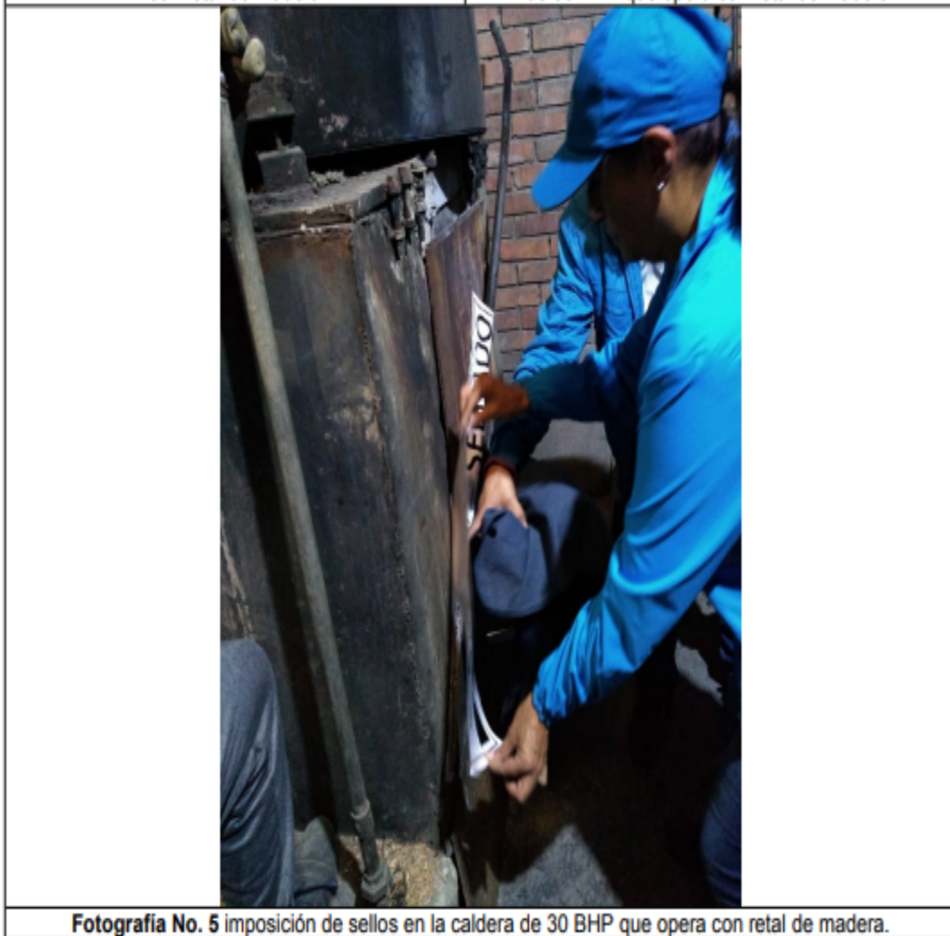
Fotografía No. 5 imposición de sellos en la caldera de 30 BHP que opera con retal de madera.

ALCALDÍA MAYOR DE BOGOTÁ D.C. SECRETARÍA DE AMBIENTE