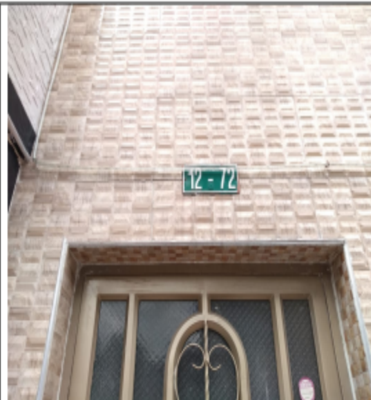
Fotografía No. 2 Placa predio