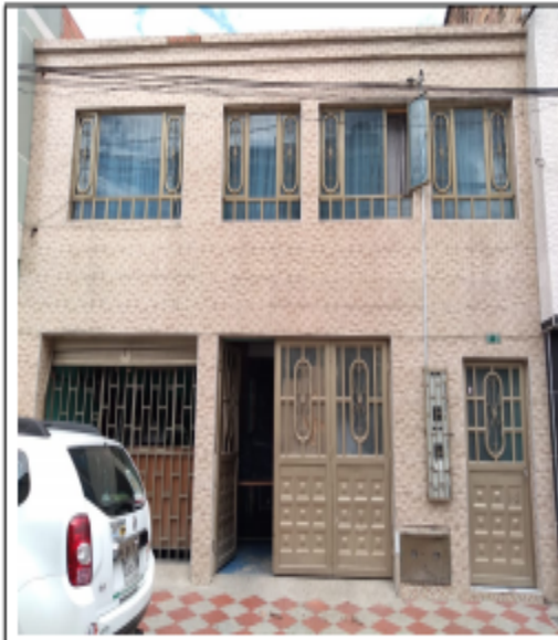
Fotografía No. 1 Fachada Predio

ALCALDÍA MAYOR DE BOGOTÁ D.C. SECRETARÍA DE AMBIENTE