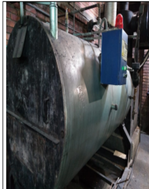
Fotografía No. 3 Caldera de 30 BHP que opera con retal de madera